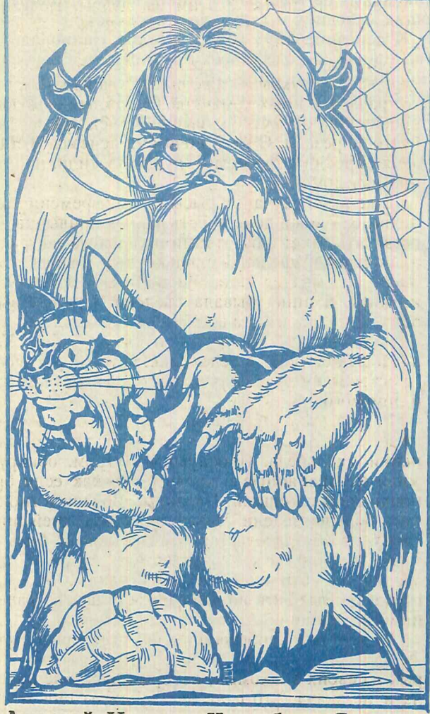
Домовой. Ипостась Чернобога — Велеса.

ментерами. Они живут теми же мыслями и чувствами, что оставили в физическом мире, любят и ненавидят так же, как и мы и мучаются оттого, что не могут принять участие в нашей жизни. Они подчиняются Высшим Силам, как и каким — не знают, либо не хотят говорить. У них свой мир, бестелесный, лишь немногим отличным от нашего. Избавившись от физического тела и став элементарями, души как бы прозревают, освобождаются от низменных инстинктов и, мучаясь раскаянием, начинают стремиться к самосовершенствованию. А путь искупления долог, иной раз длиною в века.