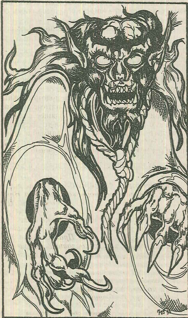
"Заложный" покойник — вампир, вурдалак.

Бытует мнение, что души умерших находятся в своем доме лишь сорок дней после смерти, а потом возносятся к Богу. Один известный колдун сказал мне: с мертвыми поосторожней. Они не прощают тем, кто нарушил их покой. В тот же день я сказала духам, что разговаривать с ними больше не стану, не велено. Знали бы, как они возмутились. И ответили мне так. Быть может, тот колдун и прав, только не в этом случае. Там, где они сейчас находятся, покоя им нет и не будет до тех пор, пока не пройдет срок искупления прижизненных грехов, и они не имеют права уйти совсем. А те, кто оставил за собой незавершенные дела, и те, кто изнемогает от тревоги за близких — они не уйдут сами. Элементеры — вот как называют их на языке оккультизма. Лишившись тела, их души унесли с собою в тот, параллельный мир все свои мысли и чувства, любовь и ненависть. И они счастливы быть рядом с теми, кого любили при жизни и которые их любили. А если удастся поговорить, то они вдвойне счастливы. Ведь они рядом с нами, только мы их не видим. Если их что-то держит, они не уходят из дома, который им дорог. Они сидят с нами за обеденным столом, спят на наших постелях и даже вместе с нами читают книги. А мои духи не только читают, но и вмешиваются в обсуждение прочитанного, причем их мнение часто не совпадает с моим собственным. Как они это делают? Очень просто. Мыс-