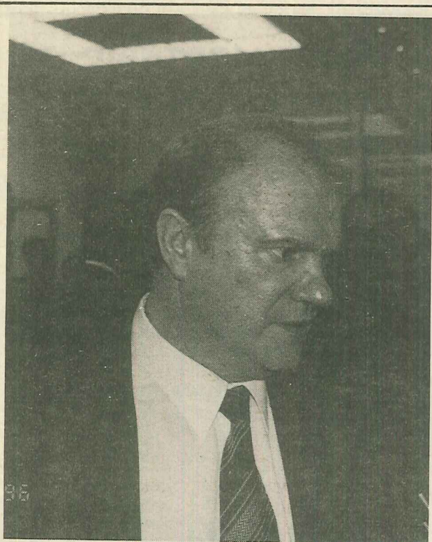
Записки из Государственной Думы