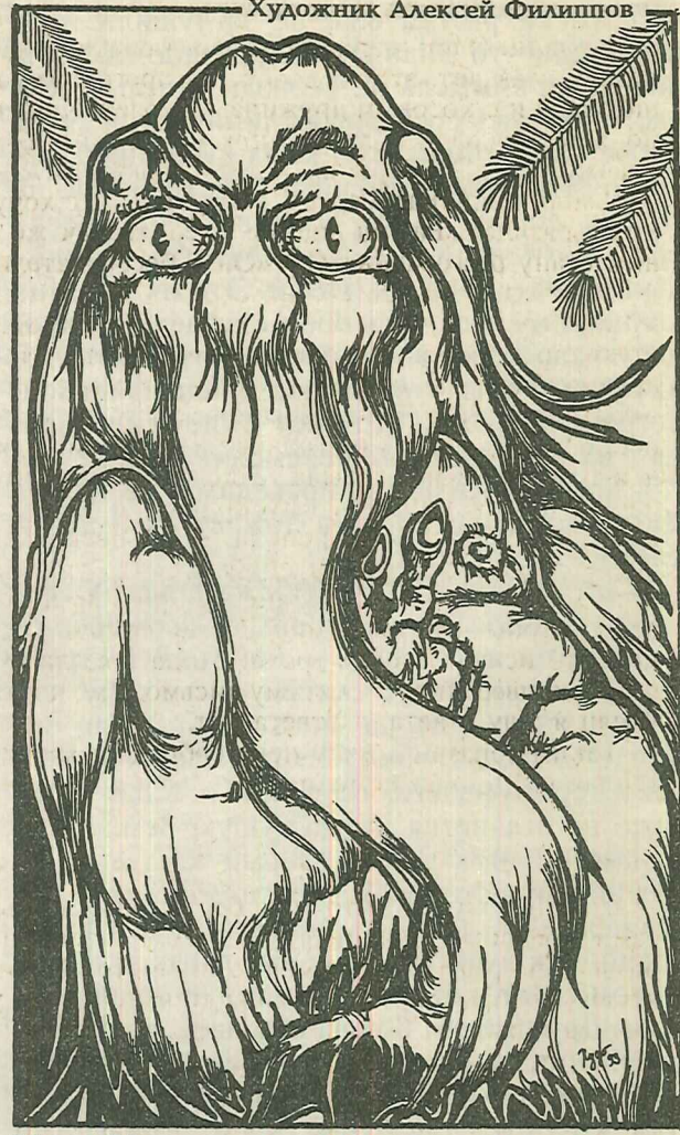
Навь. Неупокоенная злобная душа.

ленно. Не говорите только, что это одержимость. С психикой у меня все в порядке, нервы крепче чем у любого другого, я пусть не вижу, но слышу своих невидимых собеседников.