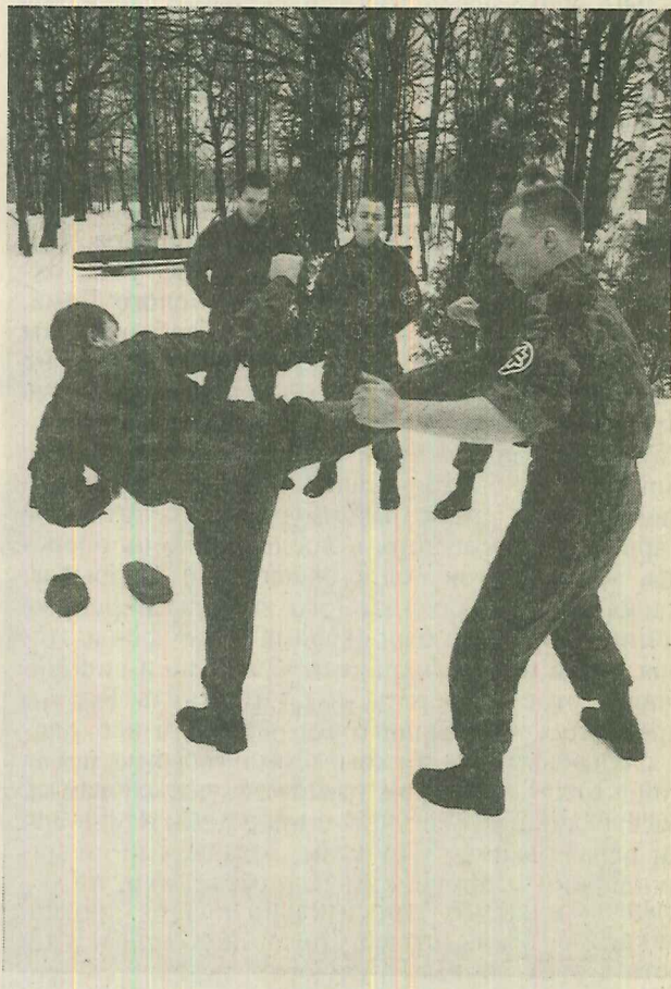
Занятия по каратэ и рукопашному бою.

Внутри помещения штаба скромно и аккуратно. Все, что здесь есть принесено или сделано самими членами клуба. В первой небольшой комнате в углу иконы, на стене большой штандарт с символикой РНЕ, портрет основателя и руководителя движения А. П. Баркашова. На столе лежит учебник начальной военной подготовки, общевоинской устав, «Азбука русского националиста» А. П. Баркашова. Во второй более просторной комнате — помещение для лекций и политзанятий. Здесь члены клуба проводят свои собрания, слушают лекции по русской истории, культуре, военному делу, смотрят учебные видеофильмы, могут отдохнуть после патрулирования (охрана пар-