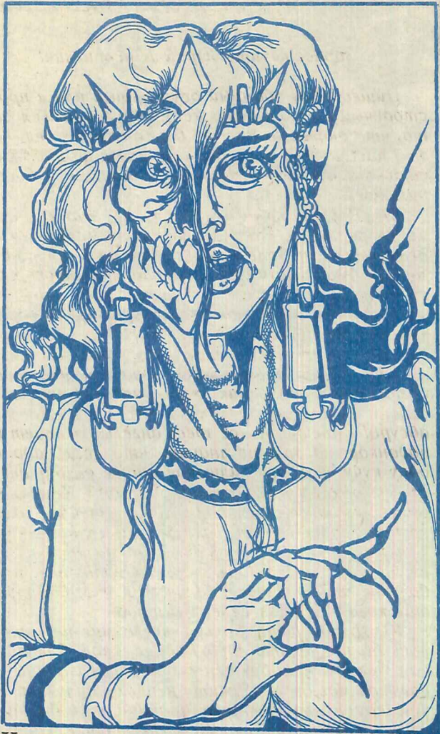
Черная ведьма — оборотень.

у него трясутся руки и ноги, сердце готово выскочить из груди, донимают головные боли и обостряются имевшиеся до того хронические болезни. Человек постепенно загибается, врачи помочь не могут, и никто ни сном ни духом не ведает, что все дело в колдовстве. Самый страшный вид порчи — на здоровье. От этого даже умирают. Но я не собираюсь толковать здесь о видах порчи и способах ее лечения, это совершенно другая тема.