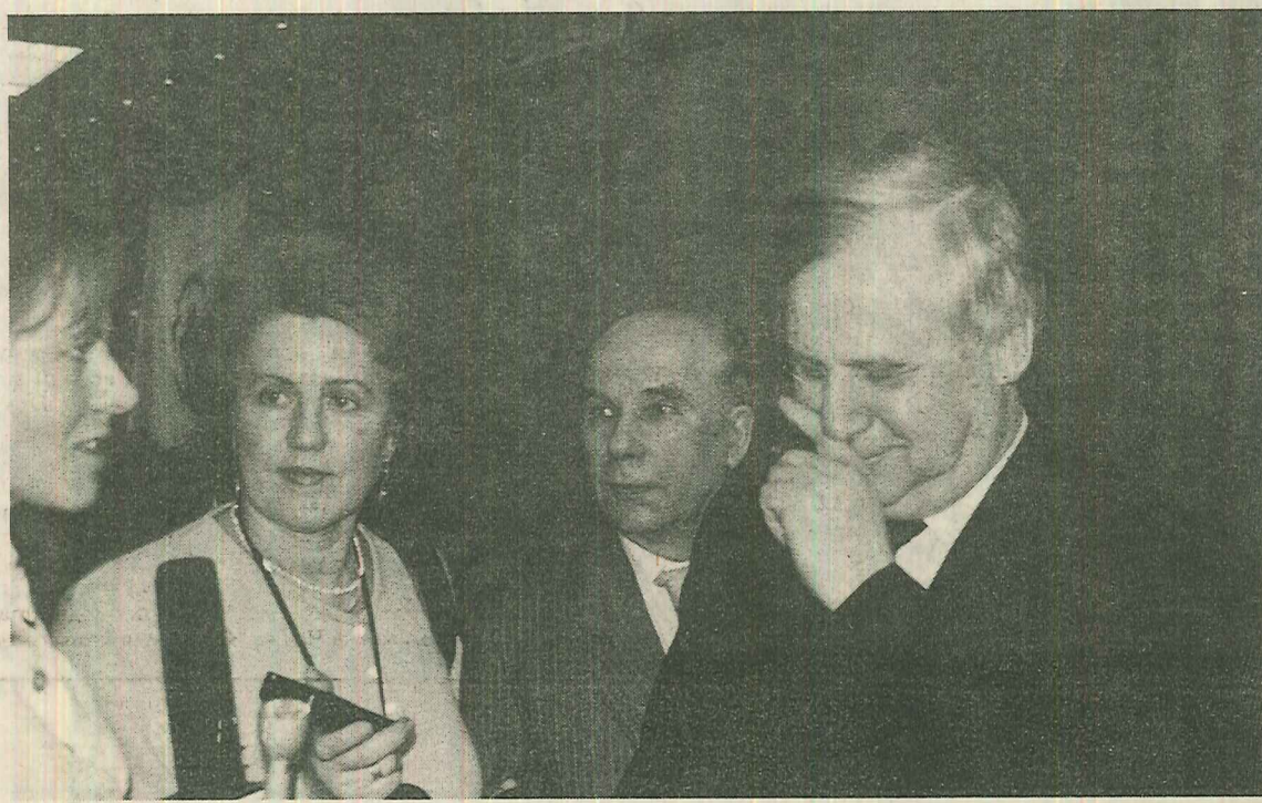
В день открытия Государственной Думы РФ. «Утрем носы "господам — демократам"!»